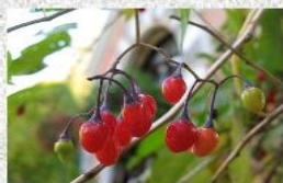
паслён сладко – горький