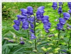
борец, он же аконит